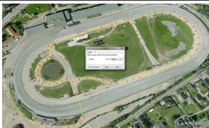
Bjerke kvalifisering Ca. 1600 m