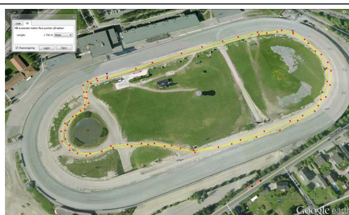
Start Kvalifisering Vest ca. 1760 m.